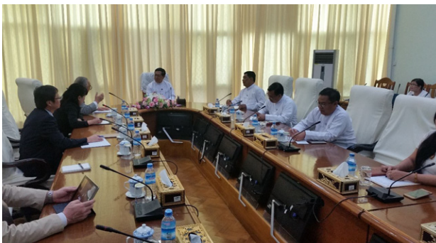
テイン・スエ労働・入国管理・人口大臣との面談