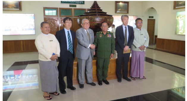
イエ・アウン国境大臣との面談