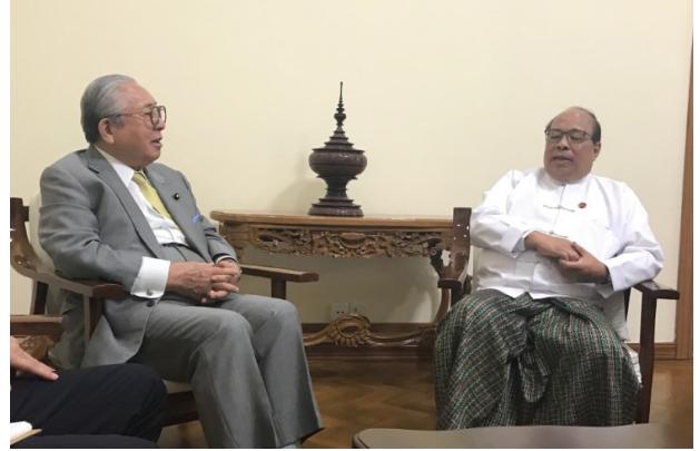
タウン・トゥン連邦政府大臣兼ミャンマー投資委員会委員長との面談