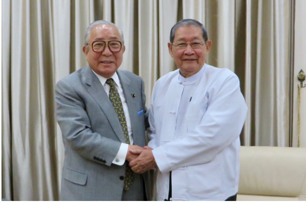
ソー・ウィン計画・財務大臣との握手