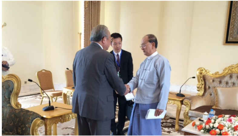
テインセイン大統領と面談