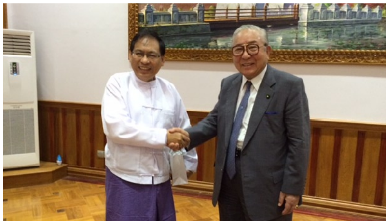
コーコーウー科学技術大臣と面談